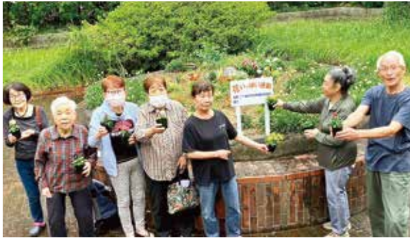
↑高御堂住宅報恩会の活動の様子

多くの皆さまのご参加とご協力により、地域に彩りと笑顔が広がり、地域の縁を育むことができました。心より感謝申し上げます。