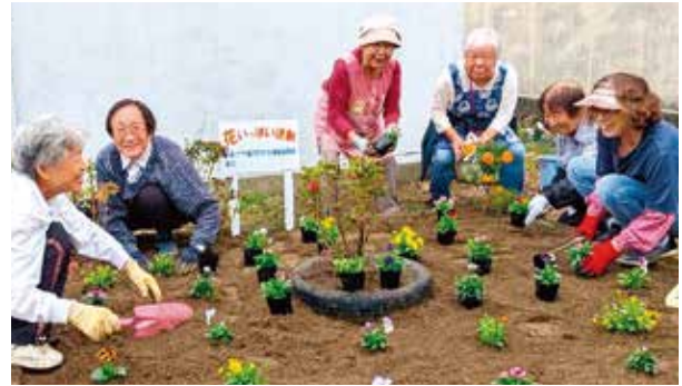
↑西島新町親和会の活動の様子