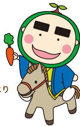
マスコットキャラクター「福ちゃん」