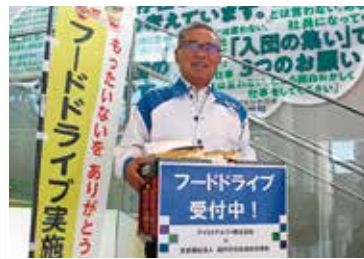
③アイコクアルファ(株)いこいの広場