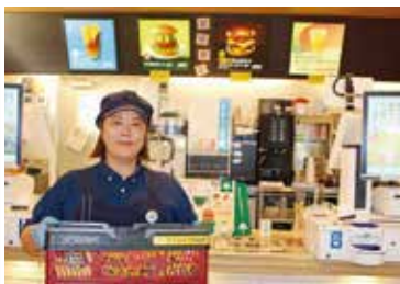
①モスバーガー稲沢天池店