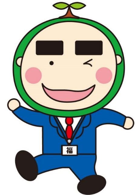
稲沢市社協マスコット 福ちゃん

重層に取り組み始めて、まだ 『2年目』 皆さんと同じ、発展途上、五里霧中、七転八倒 『等身大の取り組み紹介』 です！