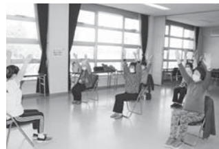
▲家族介護者交流事業の様子