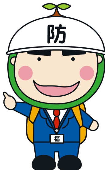
稲沢市社会福祉協議会キャラクター 福ちゃん